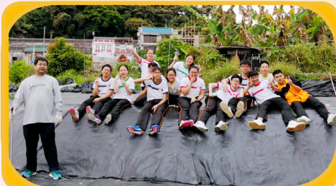
帶隊老師與參加好心情活動的同學合照。

隨著時代的進步及生活質素的變化，學生們承受的壓力及情緒都有所增加。有見及此，本校與YMCA共同合作，推行「好心情@學校」活動，向學生們提供一個歡樂與學習共存的平台。活動對象為初中學生，主要讓學生反思情緒與壓力對生活的影響，建立開朗樂觀的生活態度。當中設有工作坊、成長小組、攤位展覽及日營活動等，期盼提升學生自信心及自我效能感，當面對挑戰時，有足夠的信心及勇氣解決問題。