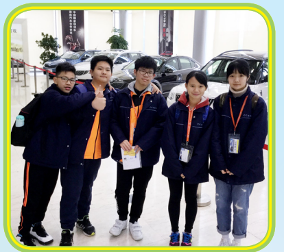
參觀上海大眾汽車有限公司，令同學們嘖為觀止。

為了幫助中二級同學適應新高中通識課程，本校於 3 月舉辦了一連四天《生活與社會科——上海學習之旅》，安排全級同學到上海進行學習與考察，讓他們體驗上海市在改革開放後的轉變及成就，從而認識上海市最新的發展，並藉著上海市急速的社會及經濟發展，進一步了解上海旅遊業蓬勃的配套發展。