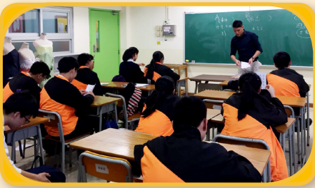
情緒管理及友誼情愛小組讓同學掌握控制情緒的技巧。