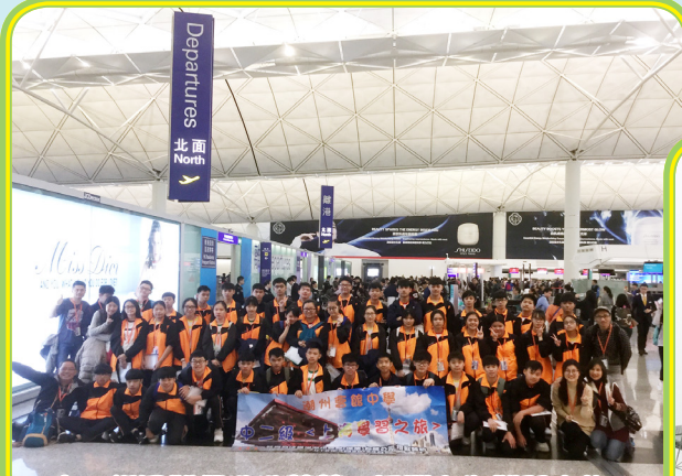
中三級同學們浩浩蕩蕩，展開上海學習之旅。