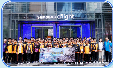
師生齊來參觀首爾「三星電子宣傳館 (SAMSUNG d'light)」，認識韓國尖端科技。