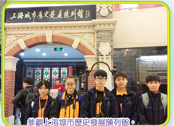
參觀上海城市歷史發展陳列館，讓同學們認識上海文化，獲益匪淺。