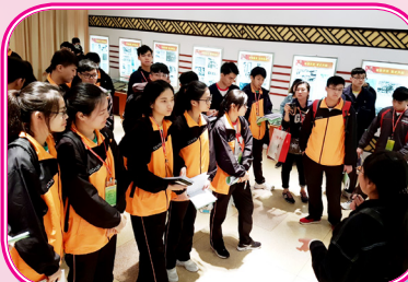
同學們參觀華僑大學校史室，了解該大學的歷史及文化。