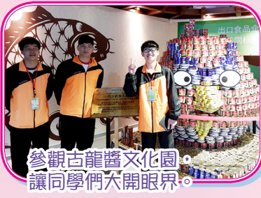
參觀古龍醬文化園，讓同學們大開眼界。