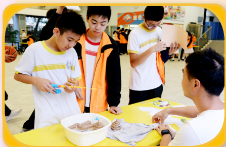
攤位展覽廣受同學歡迎。