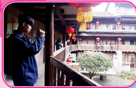
同學們實地取材，運用所學攝影技巧拍攝土樓別具特色的建築風貌。

為了加深中四級同學對內地升學與當地文化的認識，本校於 4 月為中四級同學舉辦《閩南文化考察與內地升學體驗之旅》。同學們前往福建廈門進行歷史文化考察，並參觀華僑大學廈門、泉州兩校區，讓同學了解國內大學的課程、設施、校園生活等，有助日後升學的規劃。另外，同學亦參觀永定土樓群及到鼓浪嶼考察不同的建築特色。