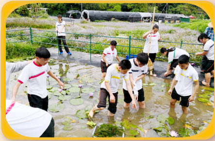
同學走出課室，參加好心情日營活動。