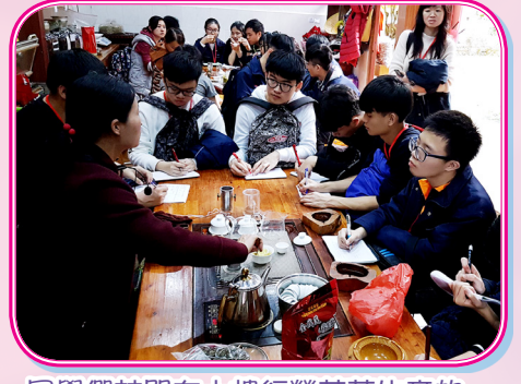
同學們訪問在土樓經營茶葉生意的居民，了解他們的日常生活。