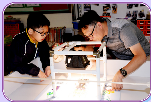
參賽同學為自己的製成品感到驚嘆！

為配合教育局推動的 STEM 教育，讓同學通過活動增強綜合和應用跨學科的知識，激發他們的創造、協作和解決問題的能力，本校於 4 月 14 日與「地球之友」合辦沙田區《小學太陽能模型車 mini 奧運會 2018》。是次比賽讓同學認識可再生能源的概念及運作模式，了解可再生能源發展的重要，並從小養成節約能源的生活習慣。當日參賽學校的同學，均全力以赴，為所屬學校爭取多個獎項。