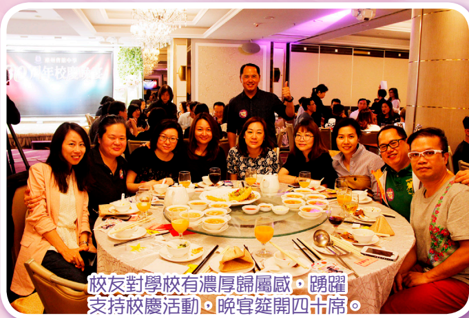
校友對學校有濃厚歸屬感，踴躍支持校慶活動。晚宴筵開四十席。