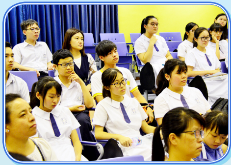
中三級同學專心聆聽領隊講解，為韓國考察之旅作好準備。

由本校辦學團體潮州會館及「賽馬會全方位學習基金」津助之中三級《韓國 STEM 教育及文化學習之旅》，於 6 月 26 至 29 日期間舉行，全體中三級同學到訪韓國進行體驗學習。本校特於 6 月 1 日晚上安排了簡介會，讓同學及家長更深入了解活動內容，在出發前作好準備。