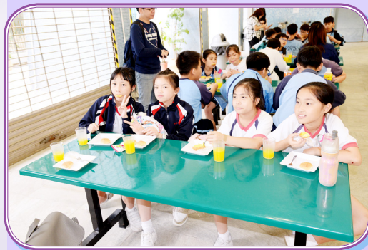
休息時間，參賽者齊來享用茶點。