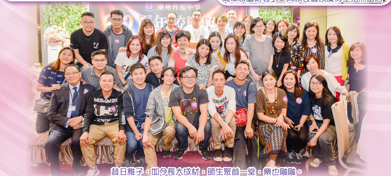
昔日稚子，如今長大成材。師生聚首一堂，樂也融融。