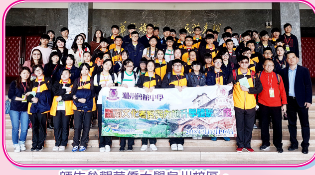
師生參觀華僑大學泉州校區。