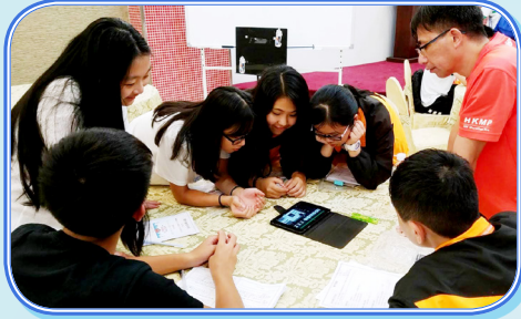
同學們考察後努力完成習作，表現積極。