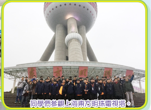
同學們參觀上海東方明珠電視塔。