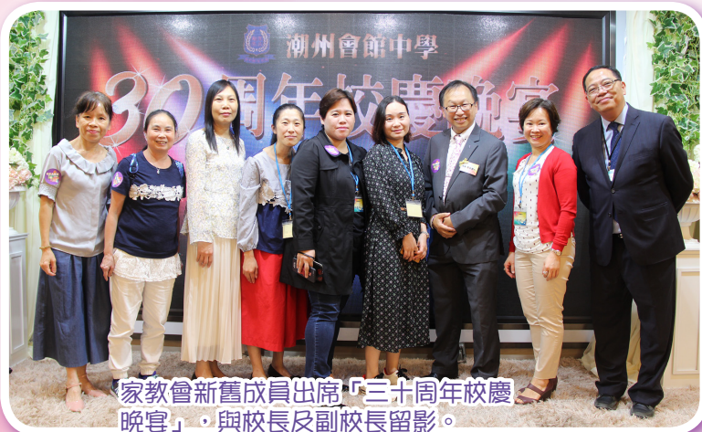
家教會新舊成員出席「三十周年校慶晚宴」，與校長及副校長留影。