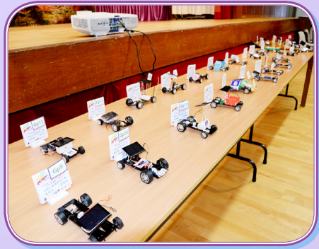
大會展示參賽隊伍的太陽能模型車製成品。