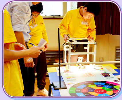
參賽者進行太陽能模型車冰壺賽。