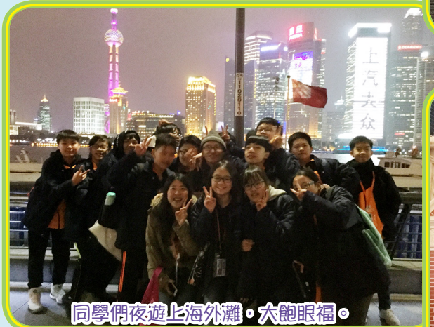
同學們夜遊上海外灘，大飽眼福。