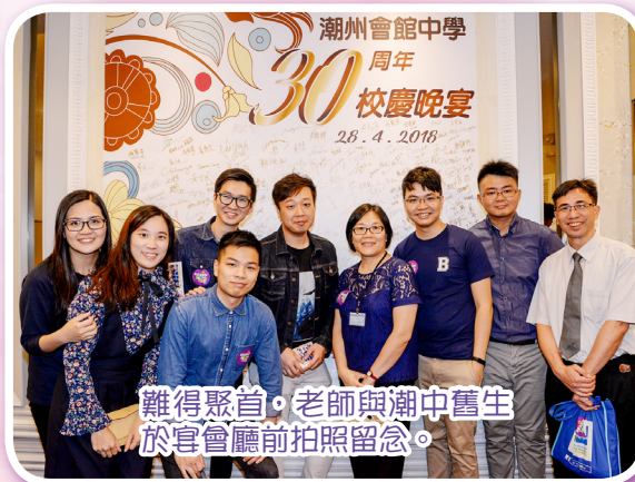
難得聚首，老師與潮中舊生於宴會廳前拍照留念。